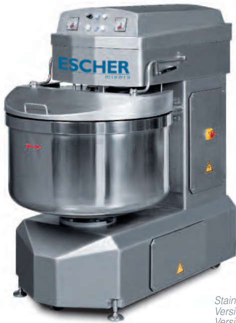
Stainless steel version Versione in acciaio inox Version en acier inox