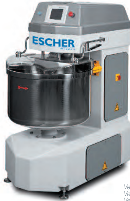
Version with touch screen Versione con touch screen Version avec écran tactile